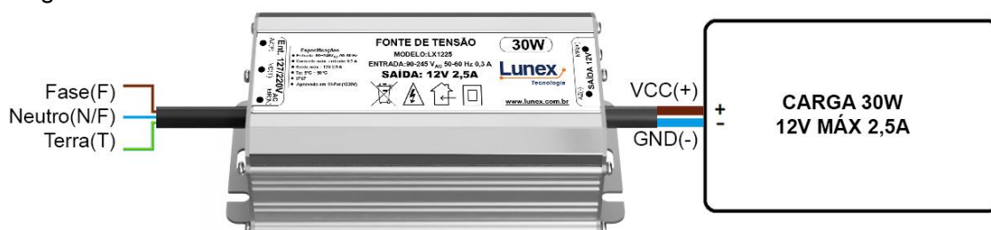
Diagrama de ligação da Fonte de Tensão LX1225-S, proporcionando uma referência visual clara para instalação e conexão do dispositivo. Facilite o processo de montagem e garanta a utilização segura e eficiente da fonte, simplificando suas instalações e obtendo máximo desempenho com nosso diagrama.