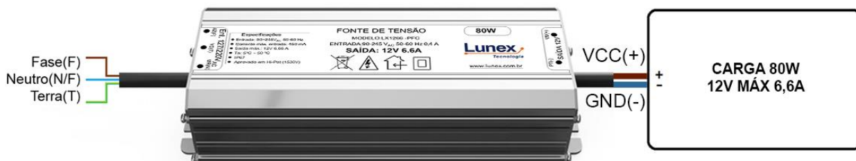
Diagrama de ligação da Fonte de Tensão LX1266-S, proporcionando uma referência visual clara para instalação e conexão do dispositivo. Facilite o processo de montagem e garanta a utilização segura e eficiente da fonte, simplificando suas instalações e obtendo máximo desempenho com nosso diagrama.